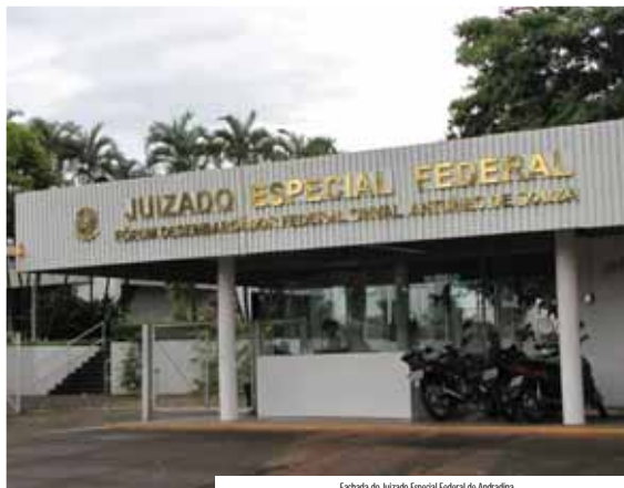
Fachada do Juizado Especial Federal de Andradina