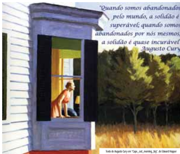
Texto de Augusto Cury em “Capo...od...morning...big”, de Edward Hopper

Soma-se a esse estresse na magistratura o paradoxo sem precedentes que atinge a maioria dos consócios das sociedades modernas: esperávamos que no século XXI tivéssemos a geração mais alegre, pois nunca a indústria do lazer foi tão grande e diversificada, como internet, TV, esporte, música, mas nunca os seres humanos foram tão